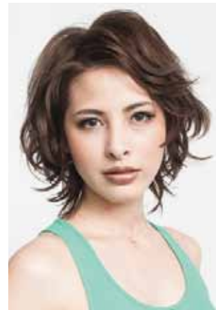
hair design_Hiroki Tanaka[bless] make-up_Eriko Yoshizaki[bless]

すべてのレシピにブルーシルバーを使用し、さりげない明度差を利用したシンプルな構成。レイヤーの重なりに合わせて、大きな三角形のチップでハイライトが入っており、表面から覗く毛先の動きが強調されている。ラフなスタイリングがよりハイライトを引き立てるとともに、フロントのローライトが、全体の印象を引き締めている。「寒色系で統一して、夏らしい透明感を表現しました」(田中)「シンプルな中にも動きがあって、完成度の高い作品ですね」(津島)