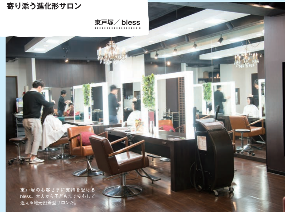
東戸塚のお客さまに支持を受けるbless。大人から子どもまで安心して通える地元密着型サロンだ。